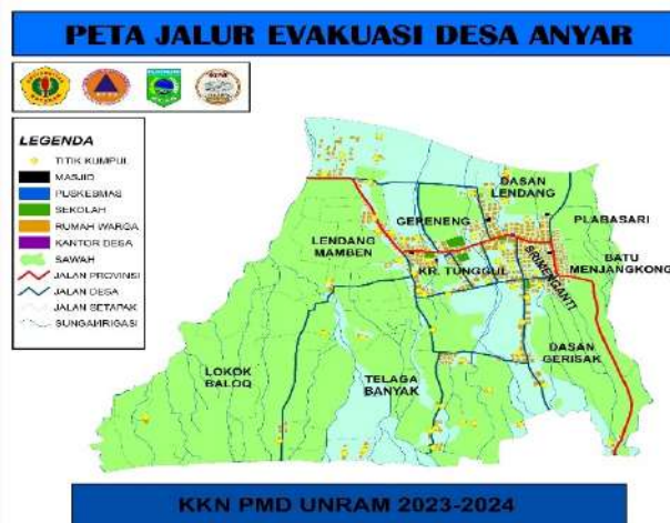
Gambar 5. Peta Beserta Jaulur Evakuasi Desa Anyar

Dalam hal ini KKN PMD Universitas Mataram Desa Anyar Periode 2023-2024 membuat peta khusus yang memberikan informasi tentang mitgasi kebencanaan secara geografis. Sehingga masyarakat desa Anyar bisa lebih paham terkait kondisi jalur evakuasi jika terjadi bencana di desa.