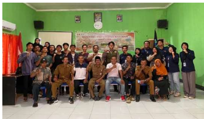
Gambar 2. Pelaksanaan Sosialisasi Mitigasi Bencana ke Masyarakat Desa Anyar

Oleh karena itu, pelaksanaan program kerja sosialisasi mitigasi bencana desa sebagai salah satu upaya meningkatkan literasi masyarakat desa dalam bidang kebencanaan. Sosialisasi ini juga langkah pertama masyarakat dalam penanggulangan dan mengurangi resiko bencana yang ada. Edukasi mengenai kebencanaan ini merupakan bagian dari program utama KKN PMD Universitas Mataram periode 2023-2024 dengan tema Desa tangguh Bencana (DESTANA) yang di lakukan di Desa Anyar, Kecamatan Bayan, Kabupaten Lombok Utara, yang dimana kami sangat berharap dari di adakannya sosialisasi mitigasi bencana ini masyarakat bisa sadar akan pentingnya kesigapsiagaan dalam menghadapi dan penanggulangan bencana desa.