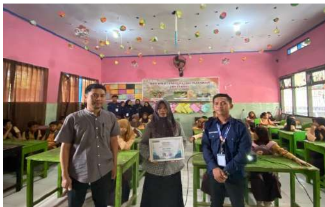
Gambar 3. Pelaksanaan Sosialisasi Mitigasi Bencana ke SDN 1 Anyar

Secara umum, seluruh warga sekolah siswa - siswi mulai kelas 1 sampai 6 SDN 1 Anyar dalam melaksanakan simulasi gempa bumi sangat bersungguh-sungguh. Kegiatan ini diharapkan dapat memberikan pengetahuan teoritis dan praktek tentang mitigasi bencana gempa bumi. Hal ini akan meningkatkan kesiapsiagaan terhadap bencana alam terutama gempa bumi di sekolah dasar sehingga diharapkan mampu meminimalkan dampak negatif dari gempa bumi. Kegiatan ini sebaiknya lebih sering dilakukan dan melibatkan komunitas sekolah yang lebih banyak.