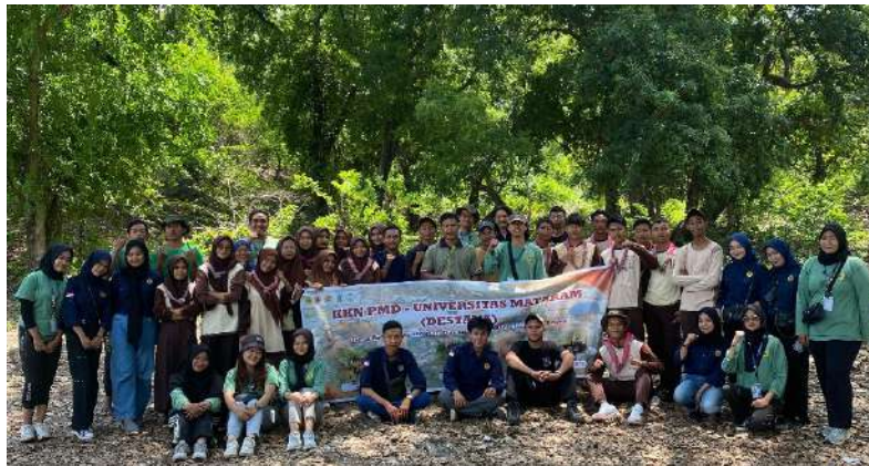
Gambar 4. Pelaksanaan Penghijauan/Reboisasi Hutan Adat Bayan

Kegiatan penghijauan ini dihadiri oleh pemerintah desa seperti kepala dusun se-desa Anyar, pengelola Sekolah Adat Bayan (SAB), Pramuka SMAN 1 Bayan dan Tim KKN PMD UNRAM Se- Kecamatan Bayan, serta masyarakat adat yang ada di sekitar hutan adat Montong Gedeng, bayan, Lombok Utara. Penanaman pohon ini diharapkan membangkitkan kesadaran masyarakat, dan juga memberikan manfaat baik bagi ekosistem. Sehingga melalui program yang dilakukan KKN PMD UNRAM Desa Anyar periode 2023-2024 ini diharapkan dapat menciptakan lingkungan yang sehat dan segar.