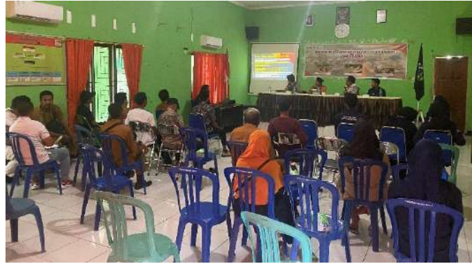
Gambar 1. Pelaksanaan Pembentukan Tim Siaga Bencana Desa Anyar